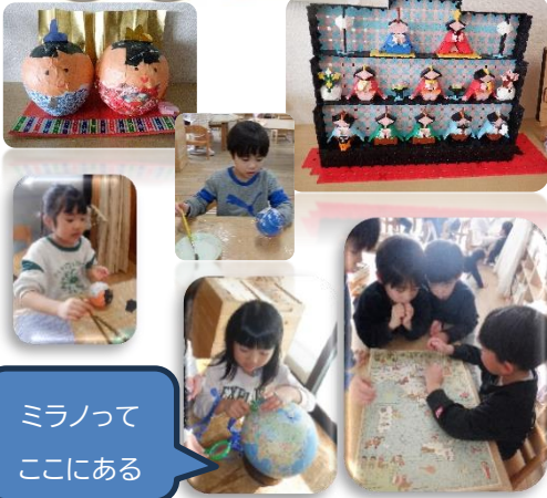
ミラノって ここにある

さらに、立春の日に飾られた雛人形を見た子ども達は、小さい風船で張り子をし、雛人形を作ることに。髪や顔、着物のバランスを考えながら貼り付け、個性が光る素敵な雛人形ができています。そのほかにも、折り紙やラキューなど工夫を重ねて飾られたひな人形も子どもたちの経験が生かされる素敵なものとなっています。