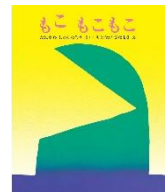
「もこもこもこ」 たにかわしゅんたろうさく